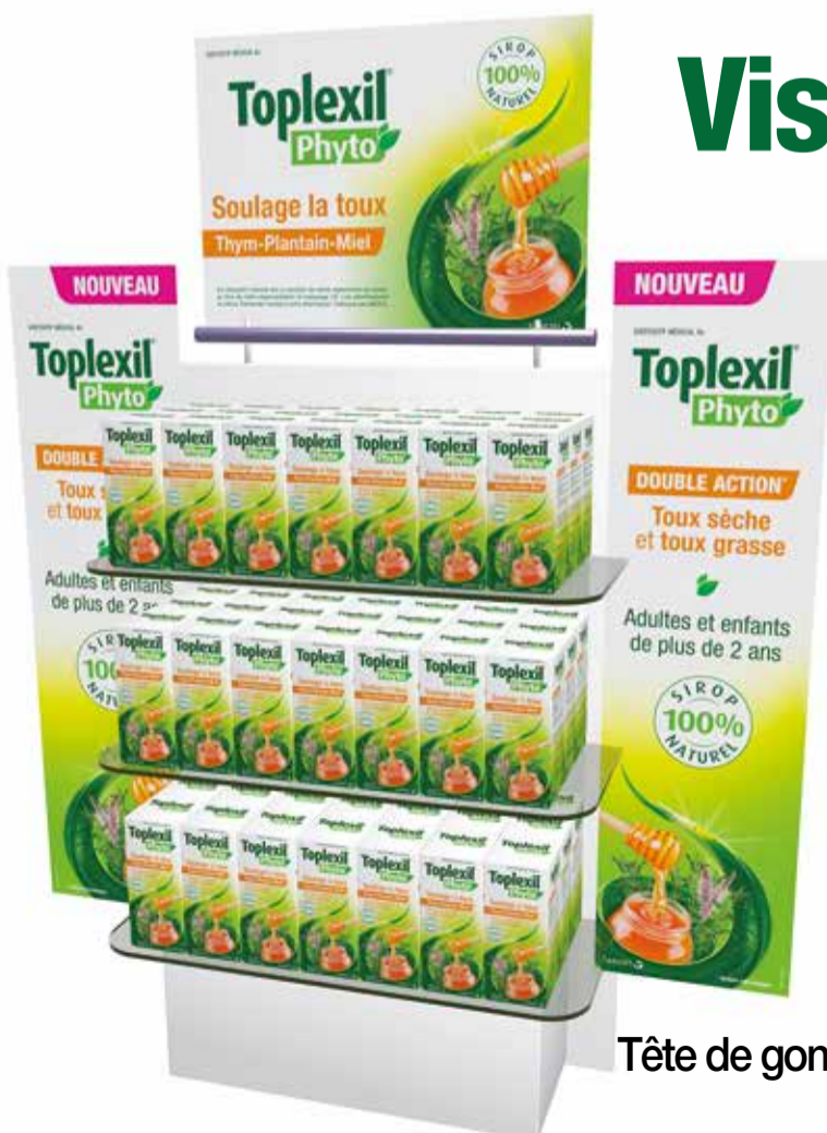
Tête de gondole